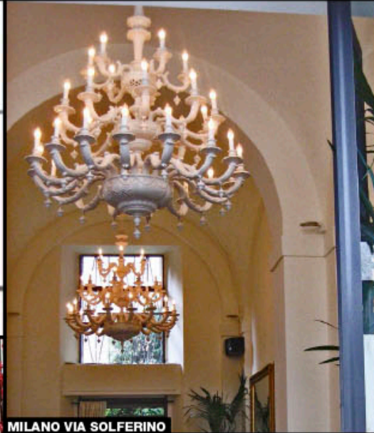
MILANO VIA SOLFERINO