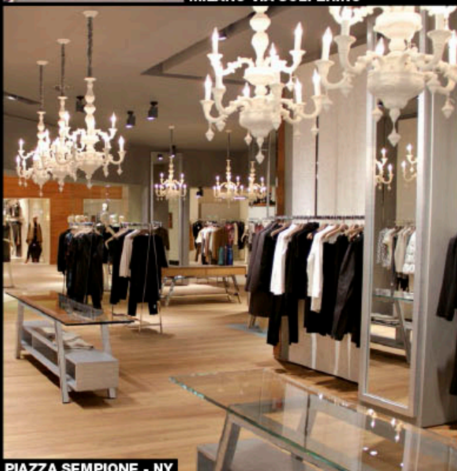
PIAZZA SEMPIONE - NY