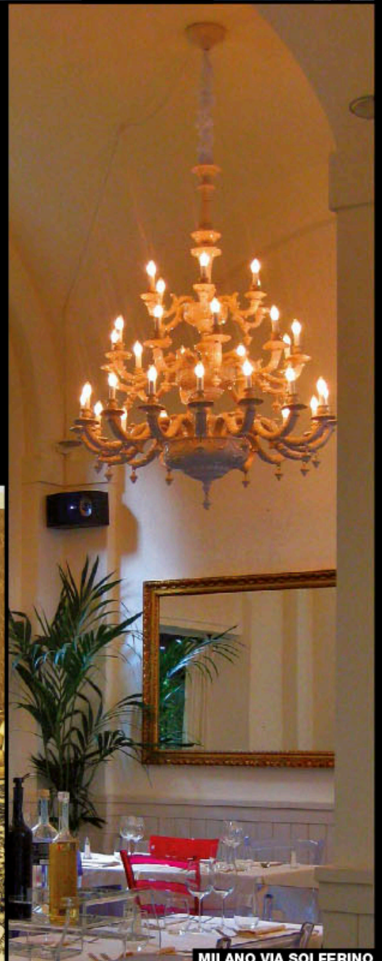
MILANO VIA SOLFERINO

Razzetti ITALY PORCELAIN & CERAMIC CHANDELIERS