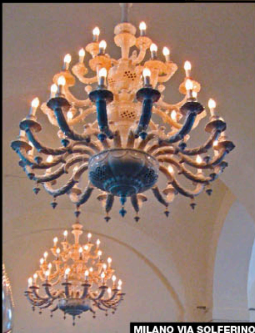
MILANO VIA SOLFERINO

Razzetti ITALY PORCELAIN & CERAMIC CHANDELIERS