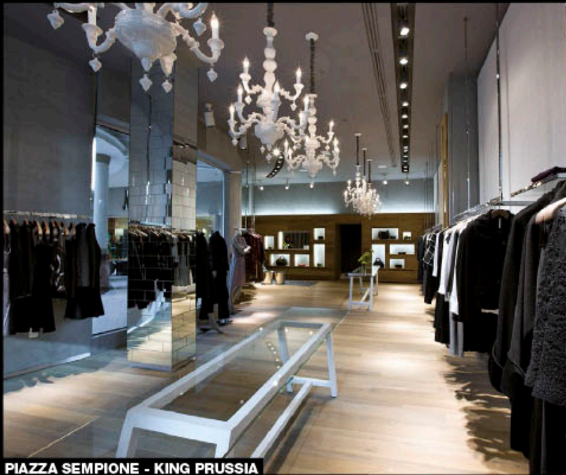
PIAZZA SEMPIONE - KING PRUSSIA